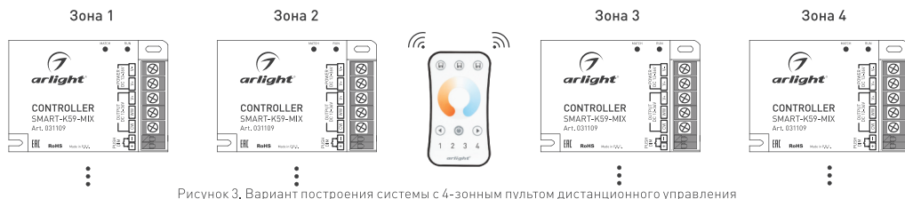
Рисунок 3. Вариант построения системы с 4-зонным пультом дистанционного управления

3.10. При использовании многозонных пультов ДУ или панелей можно построить разветвленную систему управления (рисунок 3).