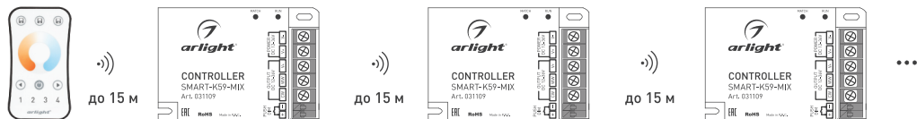
Рисунок 2. Ретрансляция сигнала от пульта ДУ (до 15 м на открытом пространстве)

Если к одному кнопочному выключателю подключено несколько контроллеров, нажмите и удерживайте более 10 секунд, на всех контроллерах установится яркость 100%.